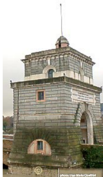
Il Torrino di ponte Milvio

- non e’ affatto facile cogliere l’anima degli elementi: oltre la densita’ della terra e dell’acqua, dietro la fiamma del fuoco e attraverso le forme del vento, solo l’occhio molto attento e’ in grado di percepire cio’ che l’occhio comune non puo’ neppure vedere. dio preservi la tua sensibilita’, la tua speciale, profonda visione di questo mondo